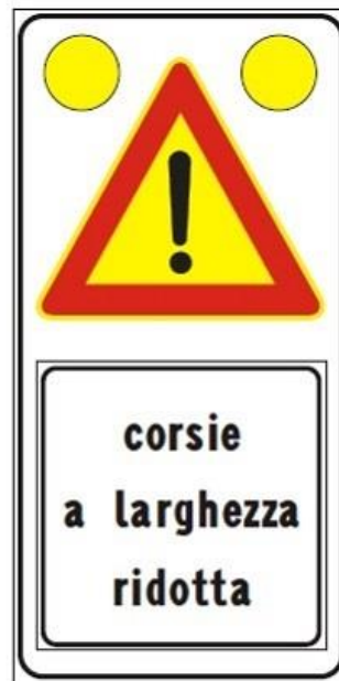
Figura Il 391c Art. 31