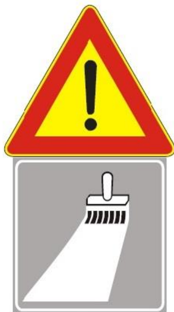
Figura Il 391 Art. 31