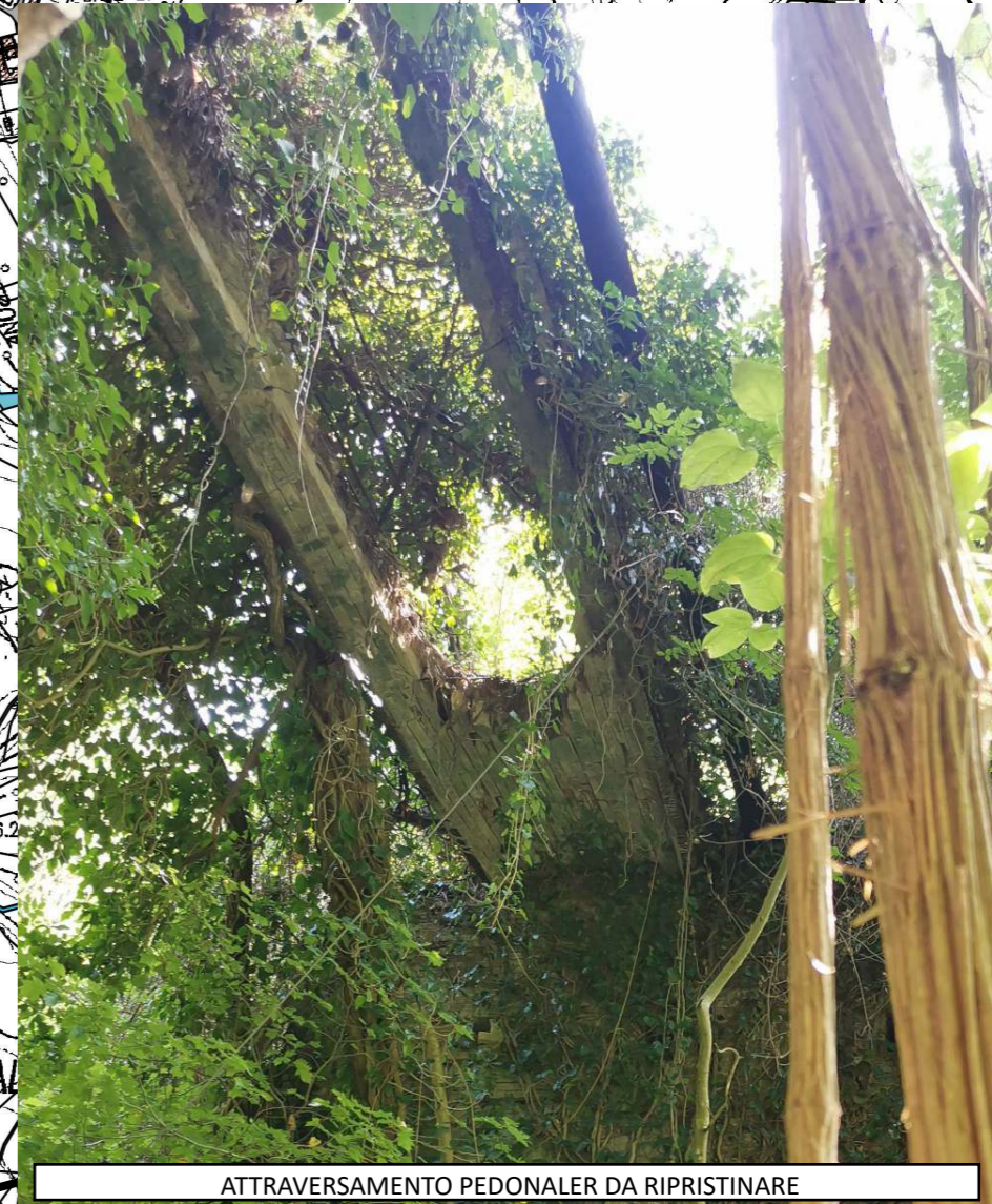
ATTRAVERSAMENTO PEDONALE DA RIPRISTINARE