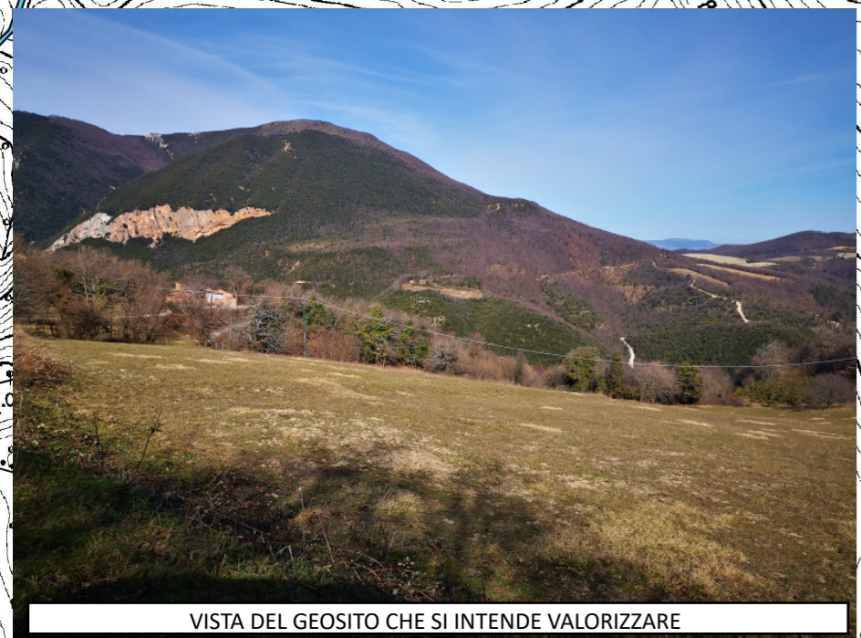
VISTA DEL GEOSITO CHE SI INTENDE VALORIZZARE