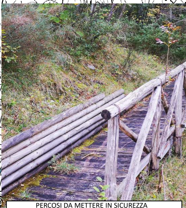
PERCORSI DA METTERE IN SICUREZZA