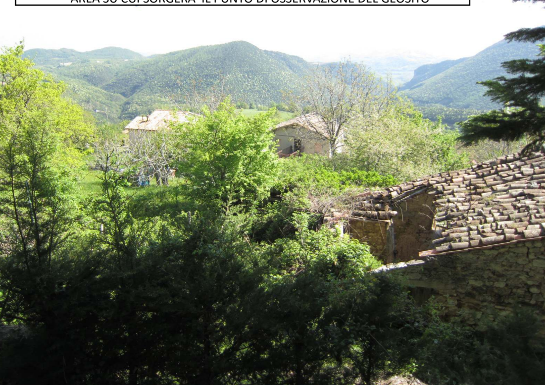
AREA SU CUI SORGERA' IL PUNTO DI OSSERVAZIONE DEL GEOSITO

UNIONE EUROPEA - REGIONE MARCHE PSR MARCHE 2014-2020 (Reg. CE 1305/2013) Misura 19 - SOSTEGNO ALLO SVILUPPO LOCALE LEADER GAL SIBILLA PSL - Piano di Sviluppo Locale Sibilla BANDI MISURA 19.2.7.5 E 19.2.7.6 OPERAZIONE A)