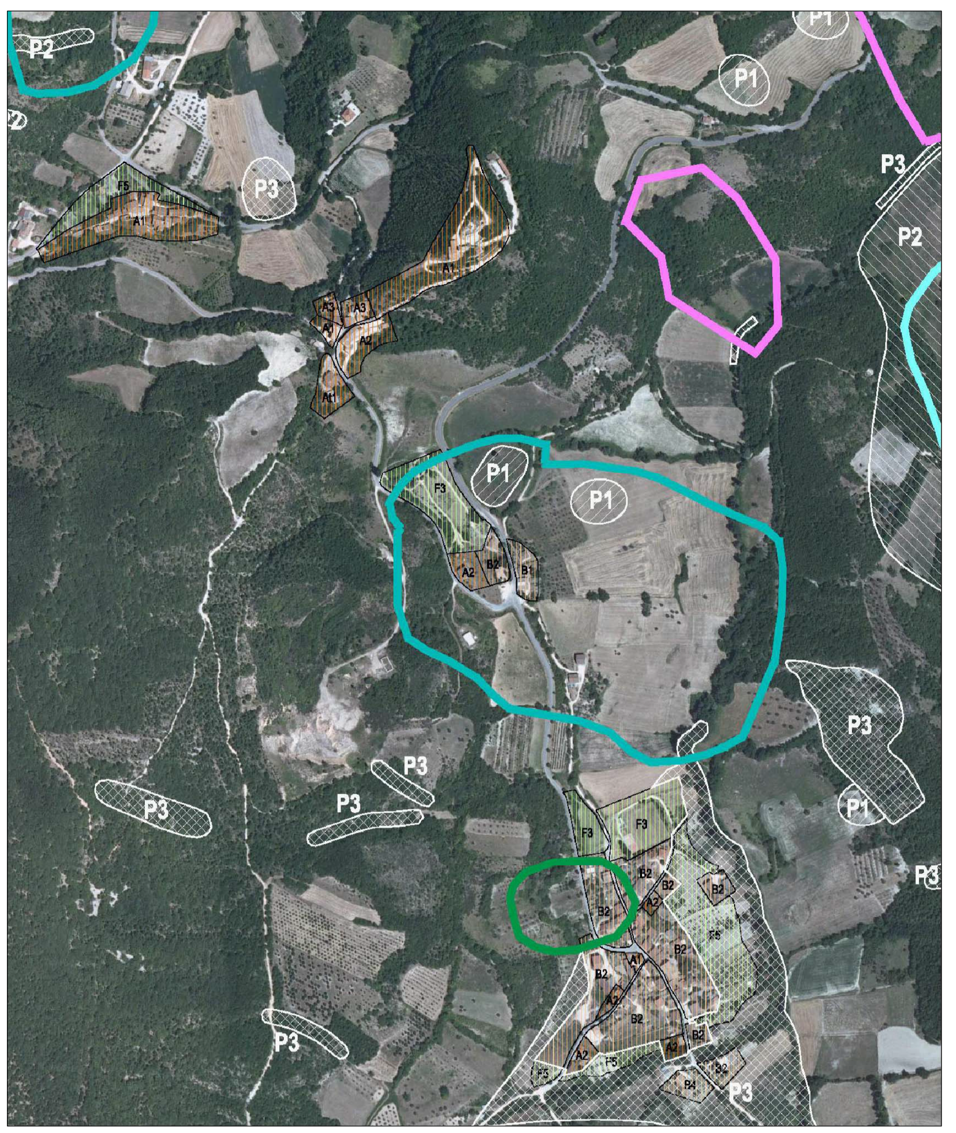
MONTALTO, VALLE, TRIBBIO, FONTEGIRATA, VILLA - 1:5.000