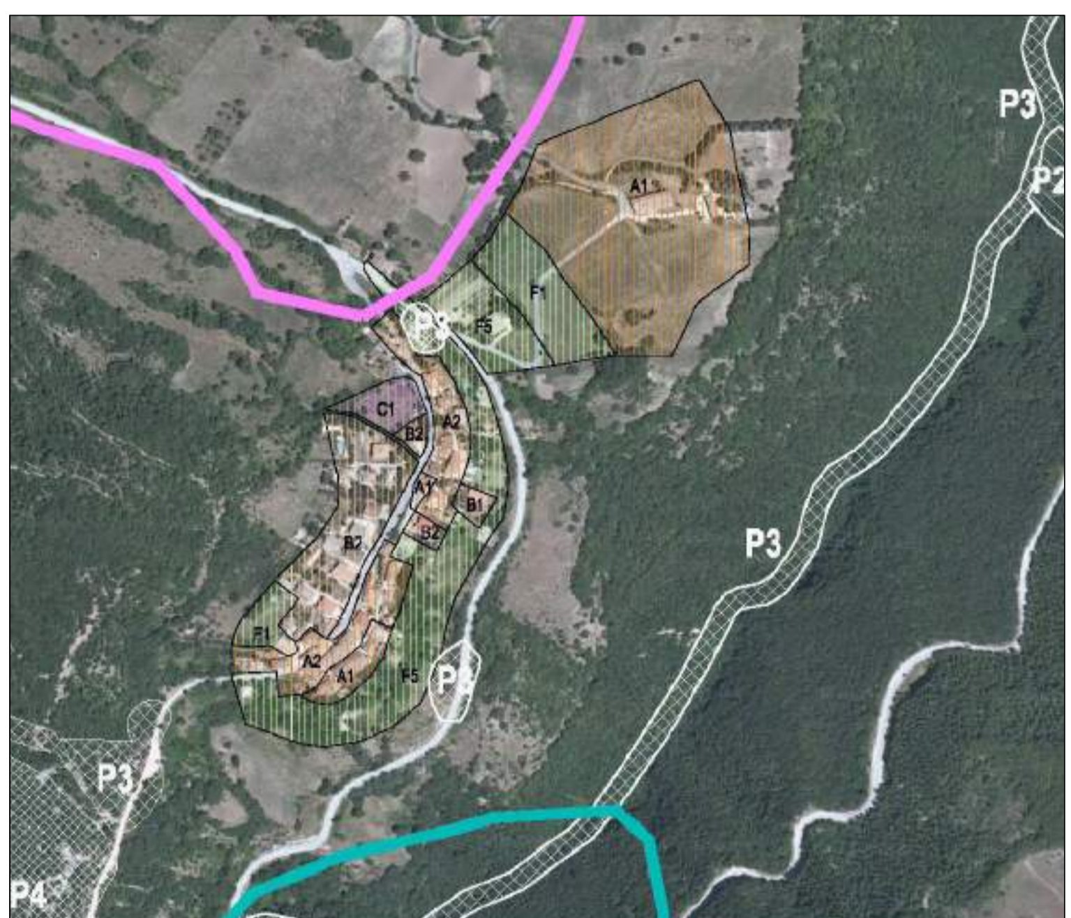
MONASTERO - 1:5.000